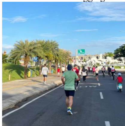
Gambar 1. Suasana Jogging di CPI